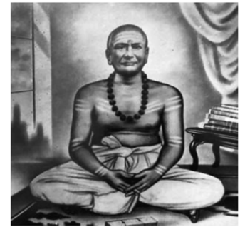
மகாவித்துவான் மீனாட்சிசுந்தரனார் (1815 - 1876)

இவர் இயற்றிய சேக்கிழார் பிள்ளைத்தமிழ் என்ற நூல் இவருடைய பெருமையை என்றும் உணர்த்தும். தல புராணங்கள் பாடுவதில் சிறந்தவர். யமக அந்தாதி, திரிபந்தாதி, வெண்பா அந்தாதிகள் ஆகியவற்றை உருவாக்கிப்